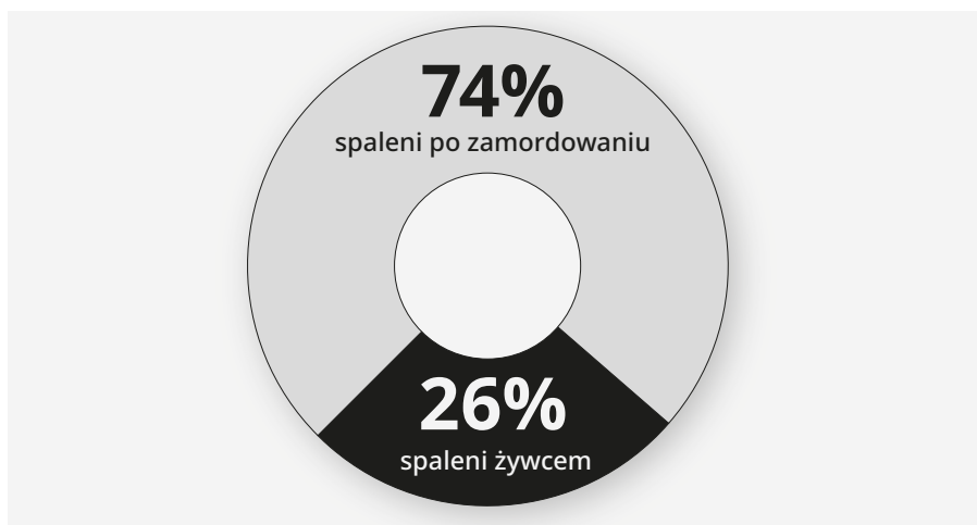
Diagram 3. Procentowe wyliczenia dotyczące spaleń. Opracowanie własne na podstawie tomu 1. Dokumentów zbrodni wołyńskiej .

Podobnych wyliczeń dokonano dla spaleń. W tomie 1. Dokumentów zbrodni wołyńskiej ofiar spalonych po uprzednim zamordowaniu było przynajmniej 312 (2% ogólnej liczby ofiar), natomiast żywcem spalono co najmniej 110 osób (0,71% ogólnej liczby ofiar). Procentowe wyliczenia dotyczące spaleń ilustruje diagram 3: